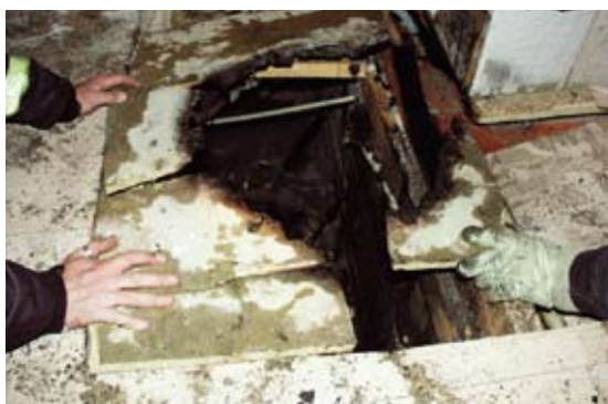
Felaktigt hanterad aska är en vanlig brandorsak. Här har golvet brunnit när aska från en kakelugn som det eldats i dagen före ställts i en plastpåse på golvet.

Bränder i bostäder är ofta eldstadsrelaterade. Därför är det viktigt att uppmärksamma säkerheten kring eldstäder. De boende behöver informeras om vad som gäller för de lokala eldstäder som finns i fastigheten, exempelvis kakelugnar och öppna spisar. Viktig information är om det får eldas i dessa, vad som i så fall får eldas, i vilken omfattning det får eldas och hur askan ska hanteras.