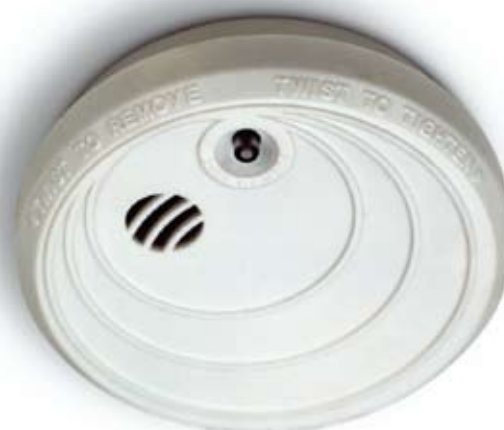
Det ska finnas minst en uppsatt och fungerande brandvarnare i varje lägenhet. Billigare liv- och egendomsförsäkring är svårt att hitta.

brandvarnare installeras, men att de boende sedan själva ansvarar för att regelbundet prova att den fungerar och byta batterier vid behov.