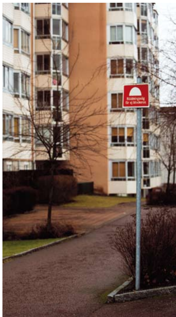
Räddningsvägar ska hållas snöröjda och fria från andra hinder.

Garage förses lämpligast med pulversläckare eftersom pulver är effektivt mot motorbränder. En sådan fungerar på de flesta typer av bränder och kan användas även för övriga utrymmen. Handbrandsläckare riskerar att bli stulna. Vill man ha släckutrustning i allmänna utrymmen kan vattenslang på rulle i ett fast skåp vara ett bra alternativ.