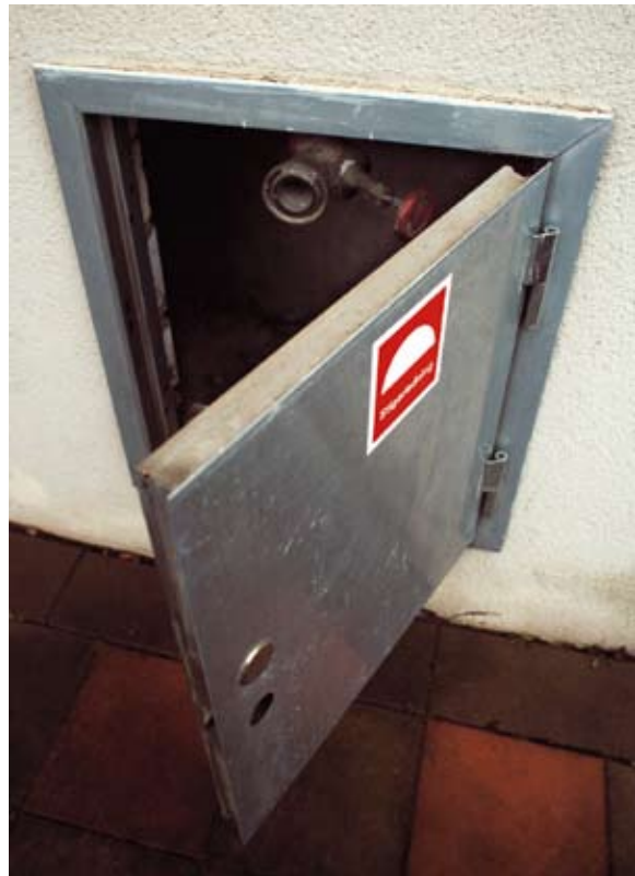
I stigarledningen i luckan på fasaden kan räddningstjänsten koppla in vatten. Inne i trapphuset finns sedan uttag där slangar kan anslutas.

I trapphus utgörs brandventilationen ibland av vanliga öppningsbara fönster. Det är viktigt att se till att lekande barn inte kan falla genom dessa. För att hindra olyckor kan exempelvis ett utvändigt galler användas.