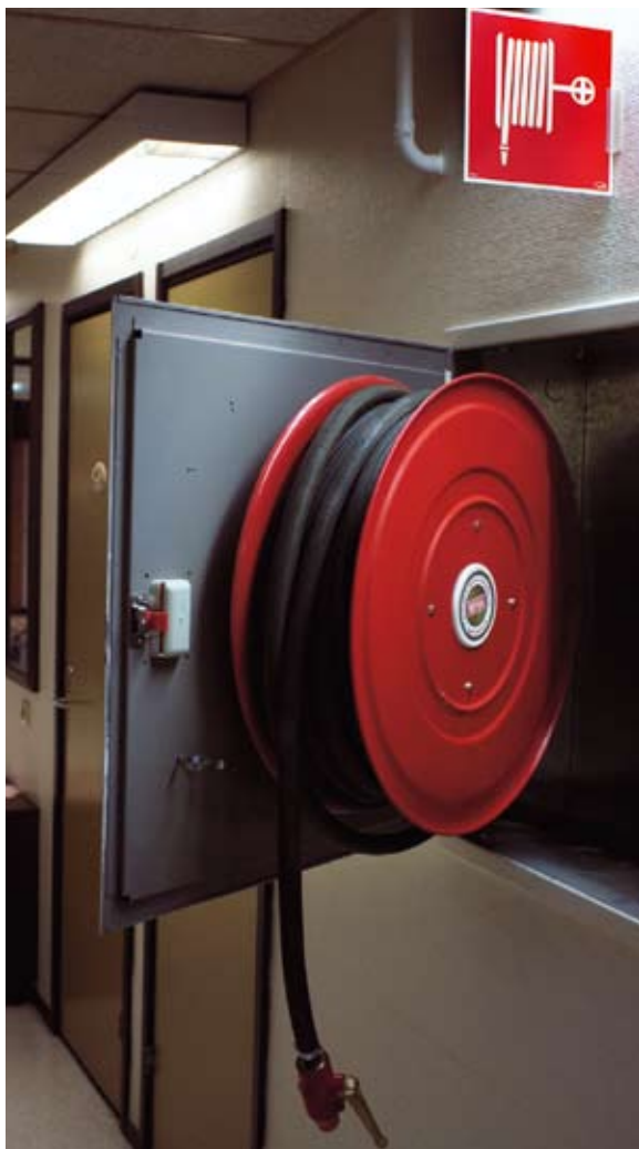
En vattenslang i styv plast är lätt att hantera och finns alltid på plats.