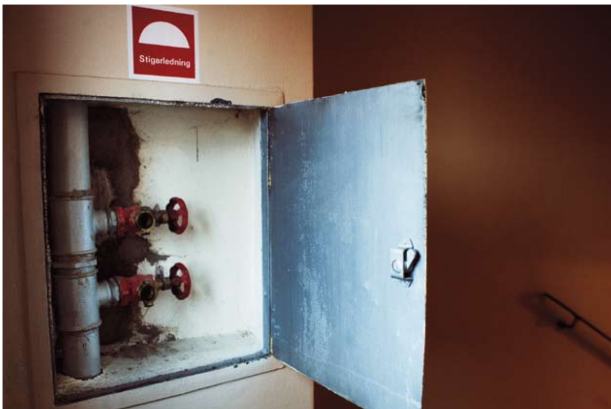
Via stigarledningen i trapphuset får räddningstjänsten vattenförsörjning utan att behöva dra slangar hela vägen från bottenvåningen.