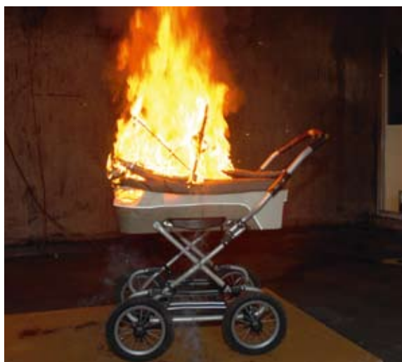
Håll trapphuset fritt från brännbart material och sådant som är i vägen vid en utrymning.

uthyrningen är det lämpligt att den som hyr ut lokalen för en dialog med hyresgästen om hur brandskyddet är tänkt att fungera när det gäller utrymningsvägar, tillåtet antal personer, eventuella larm med mera. I vissa fall kan det också vara lämpligt att tillsammans gå igenom lokalen/lokalerna innan de tas i bruk för arrangemanget. Det bör också finnas någon form av skriftlig brandskyddsinformation och checklista till hyresgästen. Sådana bör också vara uppsatta i lokalen.